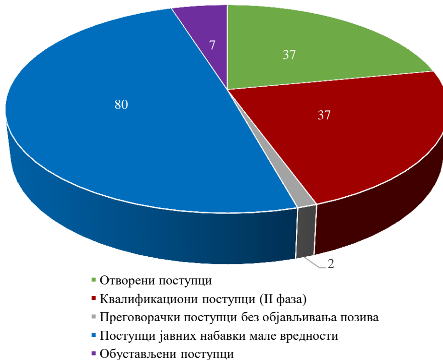
Графикон број 1. Графички приказ броја спроведених и обустављених поступака на основу Плана јавних набавки за 2020. годину